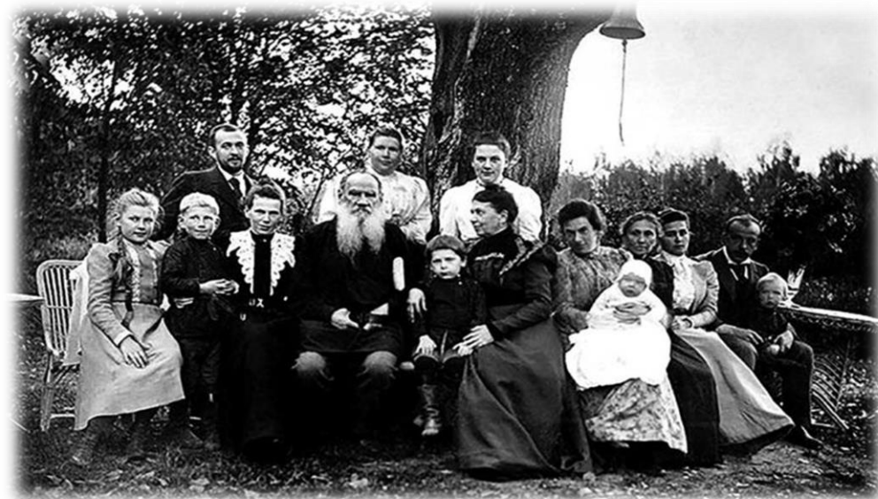
Лев Толстой с семьей

По поводу методики обучения Л.Н. Толстой высказывался очень интересно, многие из его идей достойны воплощения. Великий педагог утверждал, что только тот метод преподавания хорош, которым довольны ученики. Он считал, что универсального метода, подходящего на все случаи жизни не существует. Толстой советовал учителям экспериментировать и находить новые способы передачи знаний, проявлять творчество в своей практической педагогической деятельности.