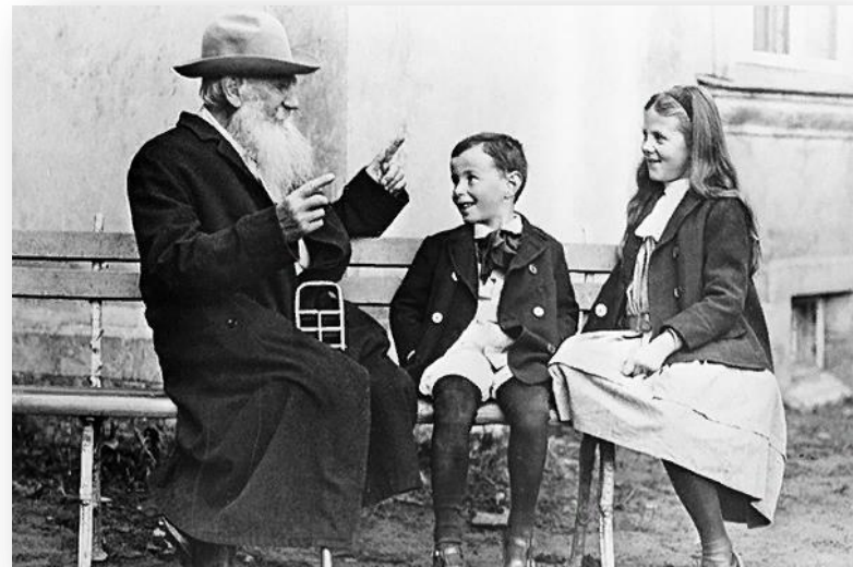
Лев Толстой рассказывает сказку внукам.

«Призвание учителя есть призвание высокое и благородное. Не тот учитель, кто получает воспитание и образование учителя, а тот, у кого есть внутренняя уверенность в том, что он есть, должен быть и не может быть иным. Эта уверенность встречается редко и может быть доказана только жертвами, которые человек приносит своему призванию»