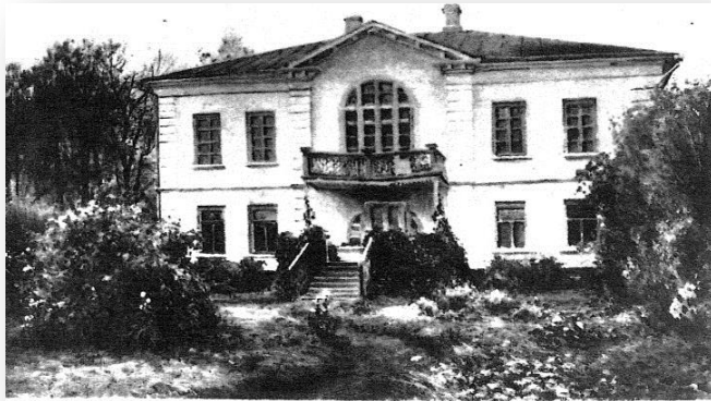
Здание школы в Ясной поляне

В Ясной Поляне открыл школу для крестьянских детей, где проводил большую экспериментальную работу по свободному воспитанию. Свои взгляды активно пропагандировал на страницах журналов, в письмах.