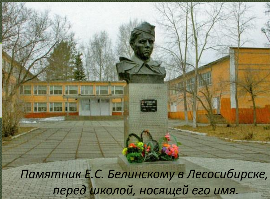
Памятник Е.С. Белинскому в Лесосибирске, перед школой, носящей его имя.

Похоронен в братской могиле в деревне Кайряй под Приекуле, Литовская ССР.