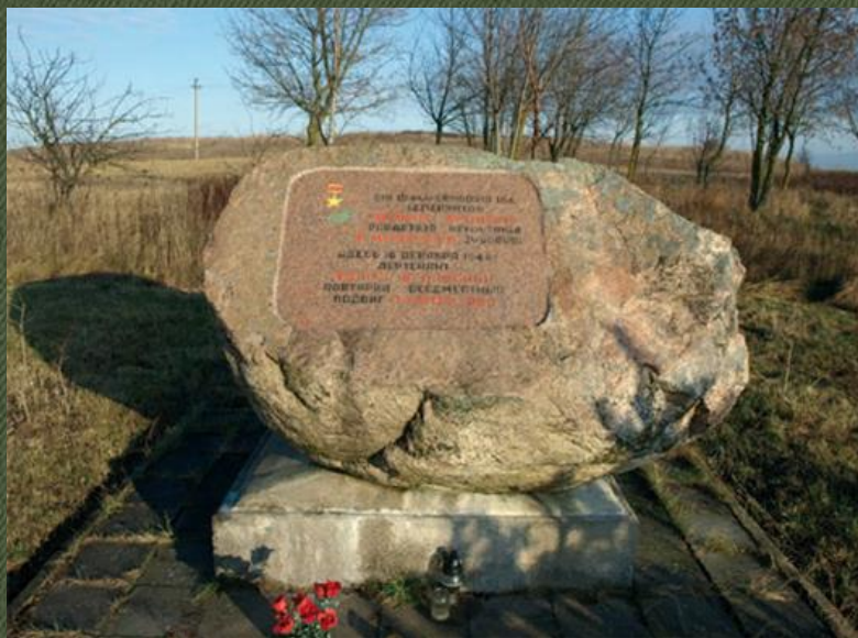
Памятник на месте гибели Е. Белинского в Литве

Ефим Белинский погиб 16 декабря 1944 года в предместье города Клайпеда (Литва), ему было всего 19 лет.