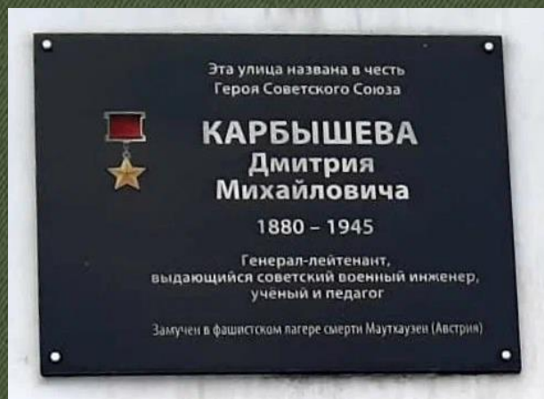
Памятная доска на здании Лицея №10 в Красноярске