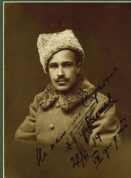
Капитан Дмитрий Карбышев, осень 1914 года