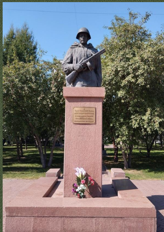
Памятник Александру Матросову в Красноярске (ул. Матросова, 12)

Именем Александра Матросова названы улицы во многих городах России.