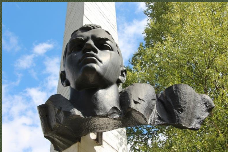
Мемориал А. Матросова в бывшей деревне Чернушки Локнянского района Псковской области