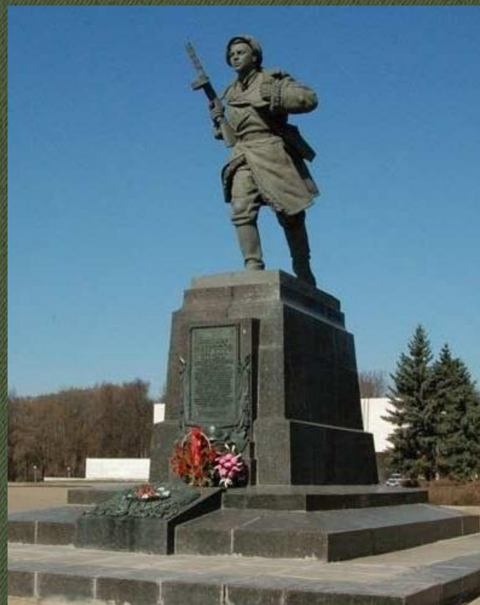
Надгробный памятник Александру Матросову в г. Великие Луки

Александр Матросов был похоронен там же, в деревне Чернушки. В 1948 году его прах был перезахоронен в городе Великие Луки Псковской области.