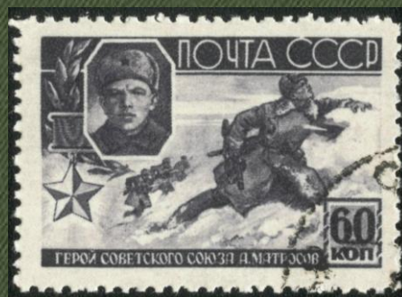
Почтовые марки из серии «Герои Советского Союза»

В городах Великие Луки, Днепропетровск (Днепр, Украина), Ишимбай (Башкирия), Коряжма (Архангельская область), Красноярск, Санкт-Петербург, Ульяновск, Уфа были установлены памятники Матросову.