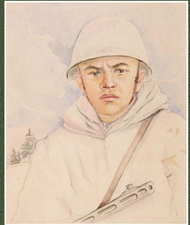
Б.Я. Ряузов «А. Матросов». 1943